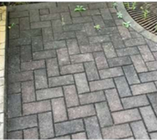
中庭 BEFORE ↓

図書館のもう1つの出入口も確保したよ！ 文庫本は「9類文学」の近くへ移動、ライトノベルはコミックコーナーへ移動し、より読みやすく。新書と時事関係の本や小論文対策本は近くにまとめました。自習スペースもしっかり確保。とにかく見に来てみて！