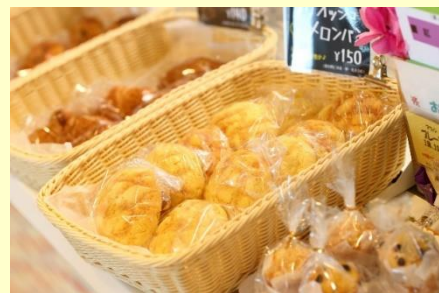
日本郵政株式会社 JP CAST https://www.jpcast.japanpost.jp/2024/01/381.html (2024年1月9日)

くカフェ「Eat+Care」があります。店内でも焼き上げられ、社員からの人気も上々のようです。この事業を担当したダイバーシティ推進室の担当者は、「互いの個を尊重し、認め・高め合い、それぞれの役割を果たし、成果を上げることと多様化する社会ニーズに応え、社員・お客さまの満足へとつなげる」という、ダイバーシティ方針を、社内に浸透させるべく、さまざまな活動に取り組んでいると話しています。今回の取り組みのきっかけの一つは、社内事情でカフェの運営を自前にする検討を始めた時に、それを障がい者スタッフの雇用の機会にできないかと思いついたことだそう。オープンまでには毎日のように難題が持ち上がったそうです。プロジェクトチームが目指したのは「障がいの有無にかかわらず、誰もが笑顔になれるカフェ」。多くの社員が